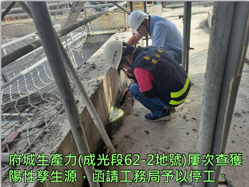
府城生產力(成光段62-2地號)屢次查獲陽性孳生源，函請工務局予以停工。